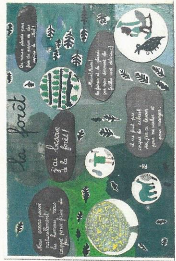
PANNEAU RÉALISÉ PAR LES ENFANTS DE FRAÏSSE-SUR-AGOUT

Il permet de découvrir, outre de larges points de vue, la statue-menhir de Picarel, l'arboretum du Triby (œuvre lui aussi des écoliers) et le « palhier » de Prat d'Alaric. Classé « Sentier du patri-